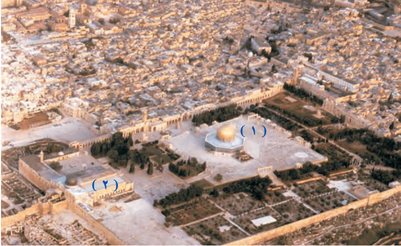
(٢) المسجد الأقصى .