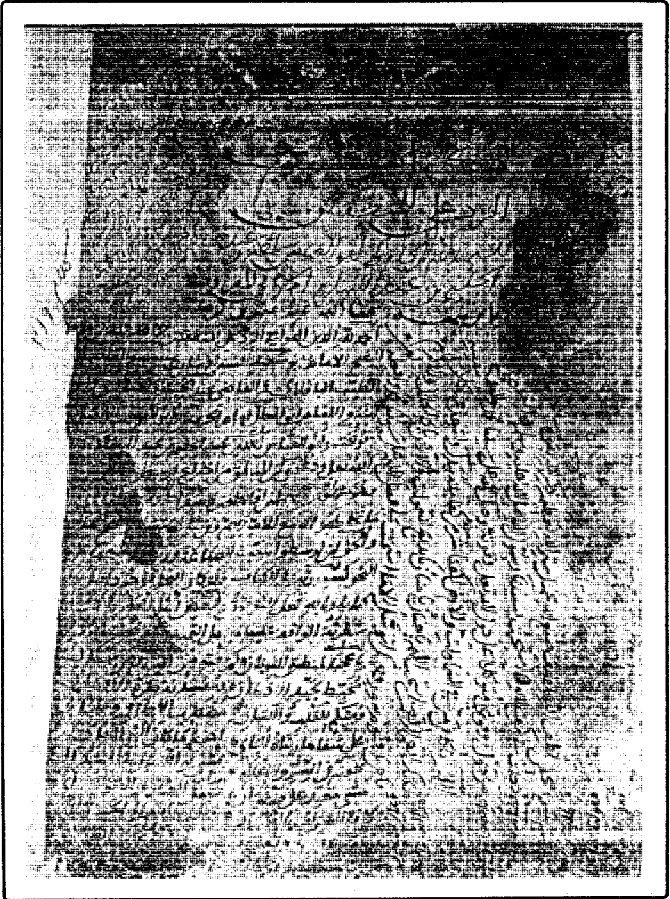
صورة غلاف النسخة الخطية من كتاب «الرد على المنطقيين» المحفوظة بخزانة الكتب الأصفية بحيدرآباد الدكن تحت رقم ٢١٩ من علم الكلام. وخفاء الصورة لانتساخ الغلاف.