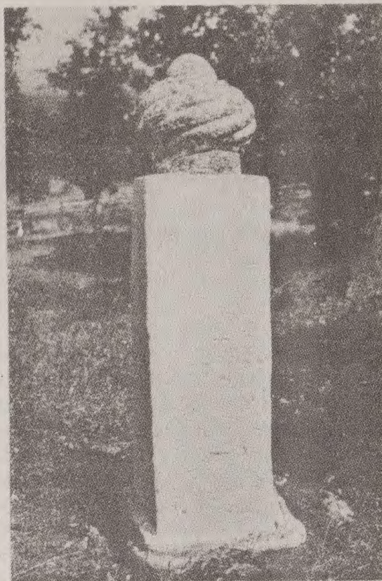
Nišan Hasana i Ahmata Radilovića u Čadovini kod Rogatice sa natpisom u bosančici iz II. pole XV. vijeka

stoji: „bir ugurden“) kroz kratko vrijeme skoro svi prešli na islam. Mnogi koji su pisali o ovom pitanju i ovdje izvrću historijsku istinu. Oni žele dokazati da bosanski muslimani nijesu u istinu stárosjedioci u Bosni i Hercegovini nego doseljenici. Oni kažu: U početku turske vlasti u ovim krajevima bilo je samo u