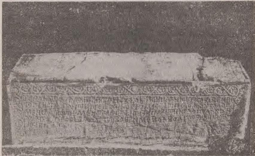
Bogomilski stećak s natpisom u bosančici u Varošištu kod Mesića u kotaru rogatičkom

Židovi su od starijih vremena imali svoju općinu u Solunu, gdje su trgovali i odakle su prolazili kroz balkanski poluotok i tako dolazili u Bugarsku. Ovdje su oni već pod kraljem Bogor-Mihajlom kušali svoju vjeru širiti. Isto se veli o Arapima i kaže se, da su dijeljenjem knjiga nastojali islam rasprostraniti. 23) Dr.